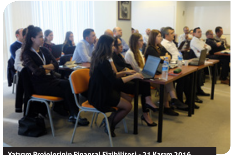
Yatırım Projelerinin Finansal Fizibilitesi - 21 Kasım 2016

İnci Akademi ile TAYSAD'ın ortaklaşa düzenlediği "Yatırım Projelerinin Finansal Fizibilitesi" seminerinde Dönmez Debriyaj, Ege Endüstri, Ege Fren, Nesan Otomotiv, Norm Cıvata, Özay Döküm, Tirsan Kardan, Sarıgözoğlu Hidrolik Makine ve Standart Cıvata'nın üst düzey yöneticileri ağırlandı.