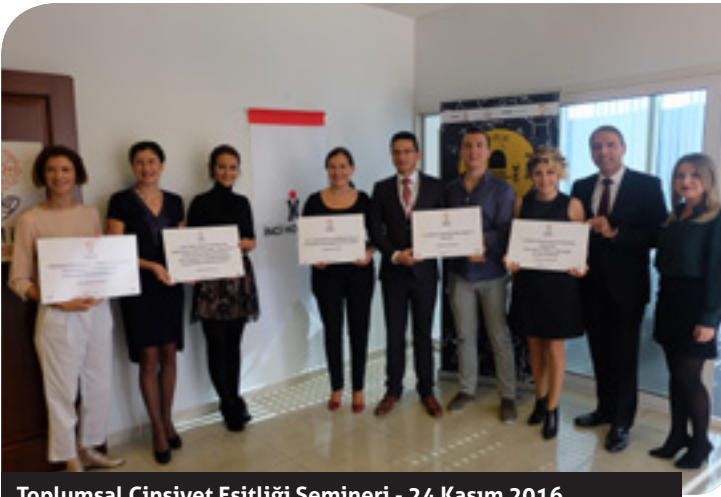
Toplumsal Cinsiyet Eşitliği Semineri - 24 Kasım 2016

İnci Akademi ile TAYSAD'ın ortaklaşa düzenlediği "Yatırım Projelerinin Finansal Fizibilitesi" seminerinde Dönmez Debriyaj, Ege Endüstri, Ege Fren, Nesan Otomotiv, Norm Cıvata, Özay Döküm, Tirsan Kardan, Sarıgözoğlu Hidrolik Makine ve Standart Cıvata'nın üst düzey yöneticileri ağırlandı.