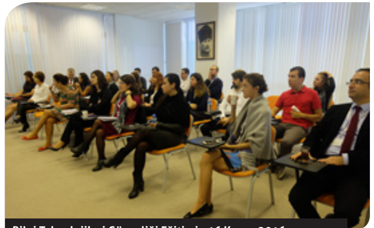
Bilgi Teknolojileri Güvenliği Eğitimi - 16 Kasım 2016

24 Kasım 2016 tarihinde Ford Otosan, Taysad ve İnci Holding işbirliğiyle "Toplumsal Cinsiyet Eşitliği" semineri gerçekleştirildi. Bu seminere Ege Bölgesi'nin önde gelen şirketlerinden Ege Fren, Ege Seramik, Eldor, Exact Systems Kalite Kontrol, Kansai Altan, Mubea Otomotiv Parçaları, Norm Cıvata, Olgun Çelik, Opet Fuchs, Ölçek Mühendislik, Pamukkale Kablo, Sarıgözoğlu Hidrolik Makina, Sismak Otomotiv, Sun Tekstil ve Tirsan Kardan'ın üst düzey yöneticileri ve çalışanları katıldı.